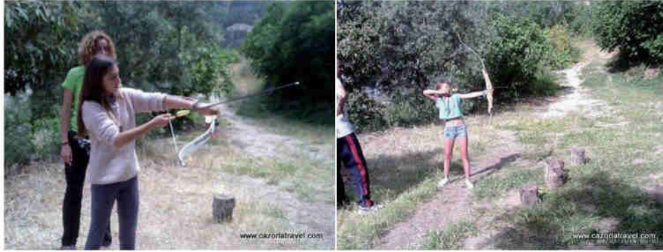
Ninos jugando y realizando actividades dentro de las instalaciones