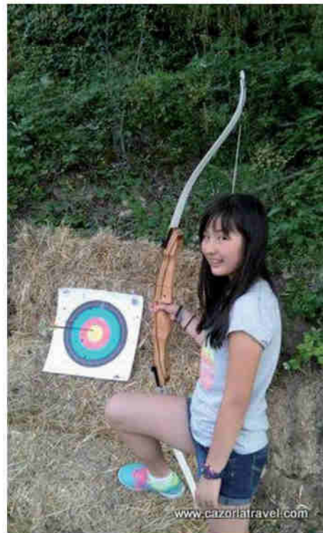
Zona para la práctica de Tiro con Arco en las Instalaciones