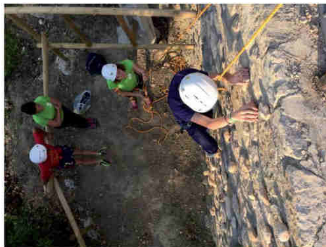
Ninos jugando y realizando actividades dentro de las instalaciones