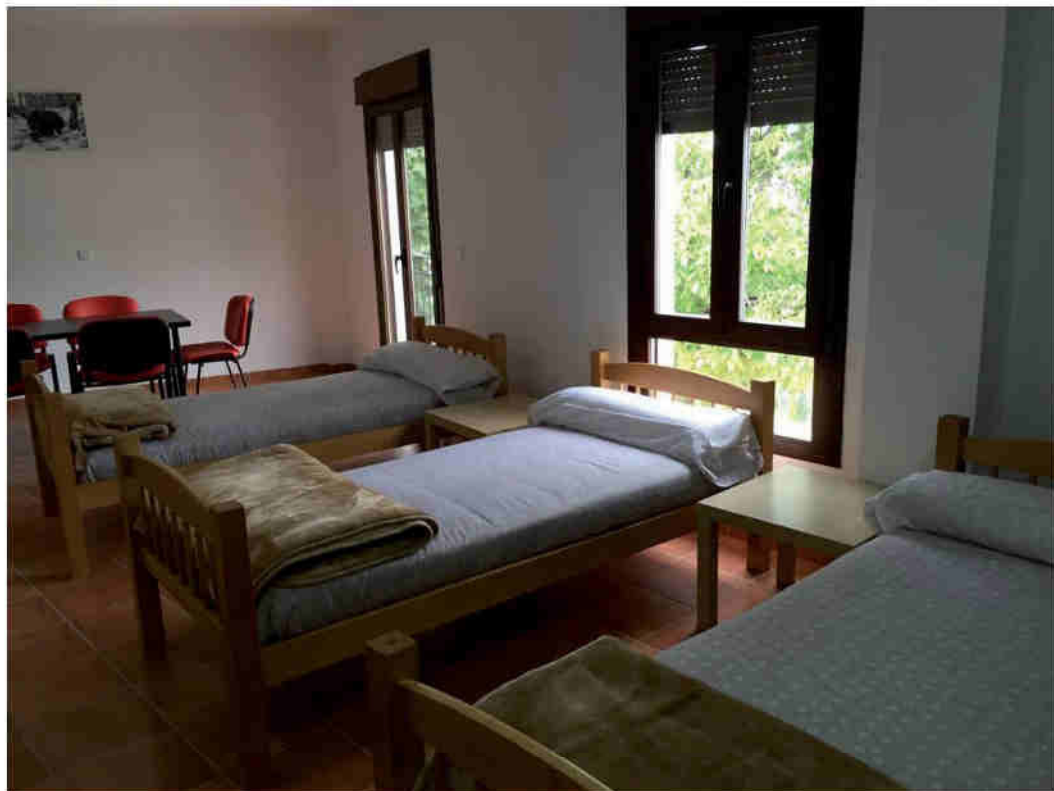
Habitación (las habitaciones en la mayoría de las ocasiones las camas individuales de 90 cm son sustituidas por literas)