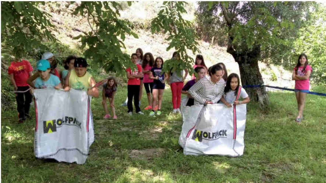
Ninos jugando y realizando actividades dentro de las instalaciones