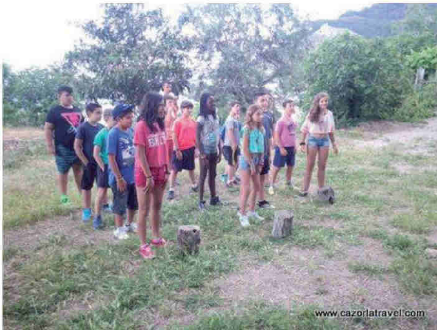
Niños jugando y realizando actividades dentro de las instalaciones