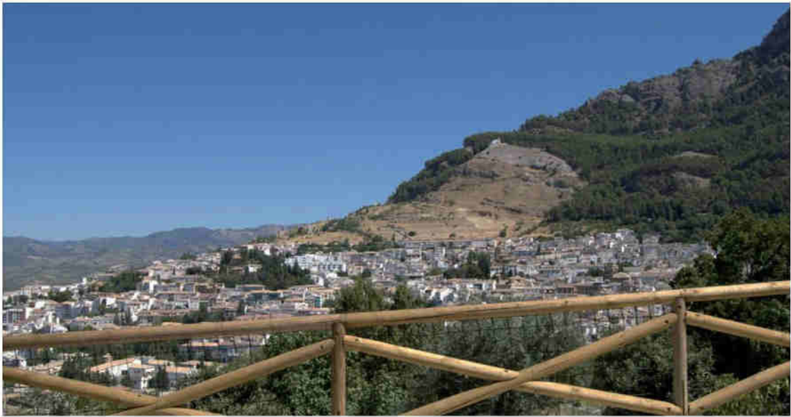
Vistas desde terraza principal