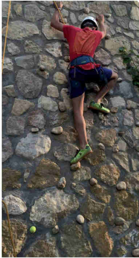
Rodadero Iniciación: escalada