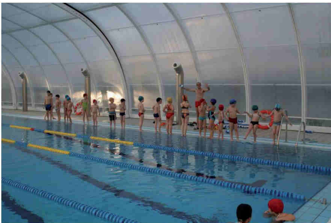
Piscina Climatizada desde febrero a junio

No contamos con piscina en nuestras instalaciones, pero tenemos un acuerdo para el uso de la piscina municipal de Cazorla, piscina que cuenta con equipo de socorristas y monitores. La piscina se encuentra ubicada a unos 15-20 minutos paseando desde nuestro centro.