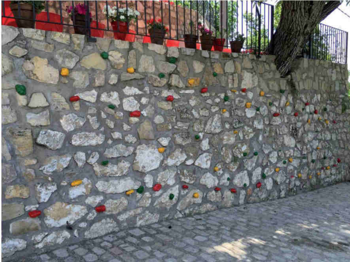
Zona de Bouldering para iniciarse a la escalada