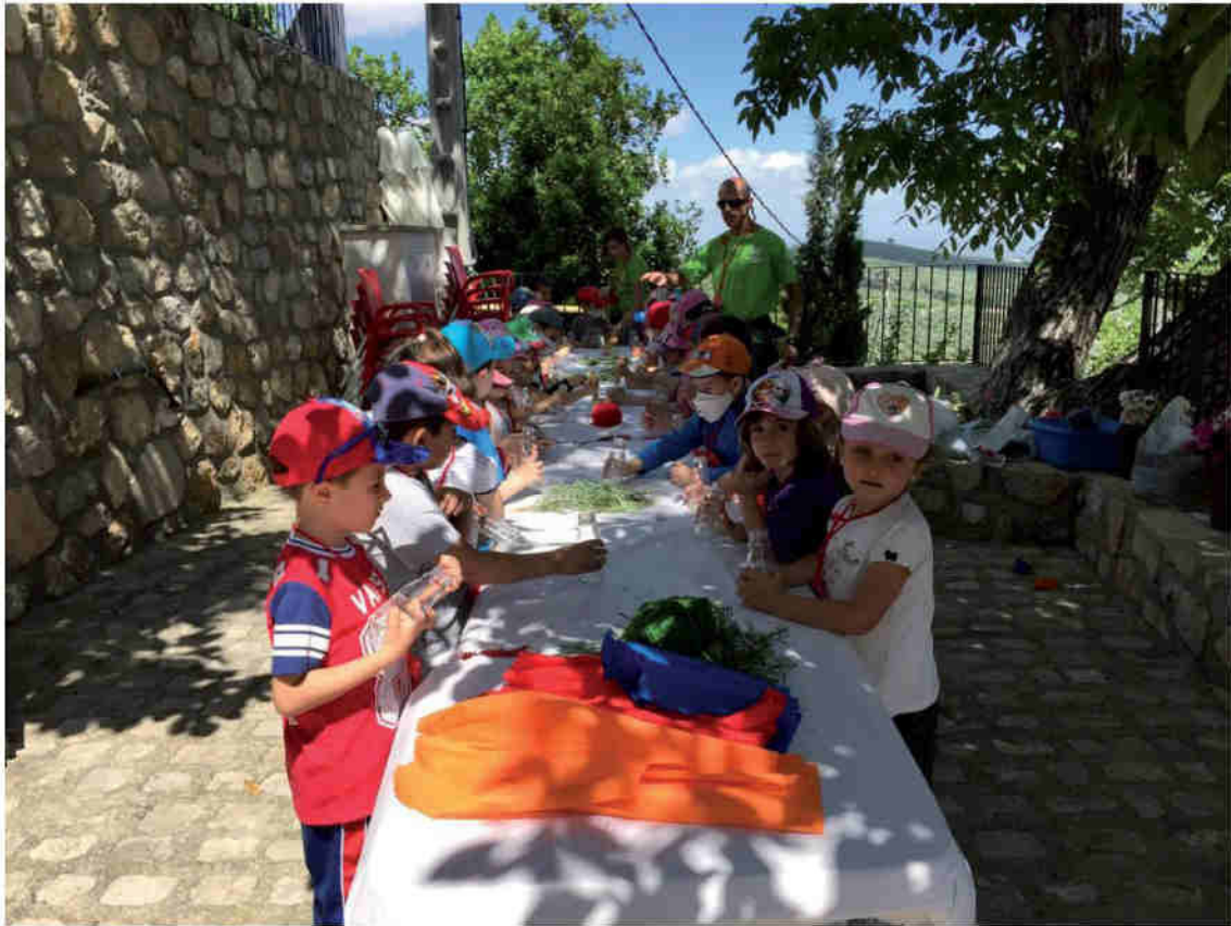
Ninos realizando Talleres en las instalaciones