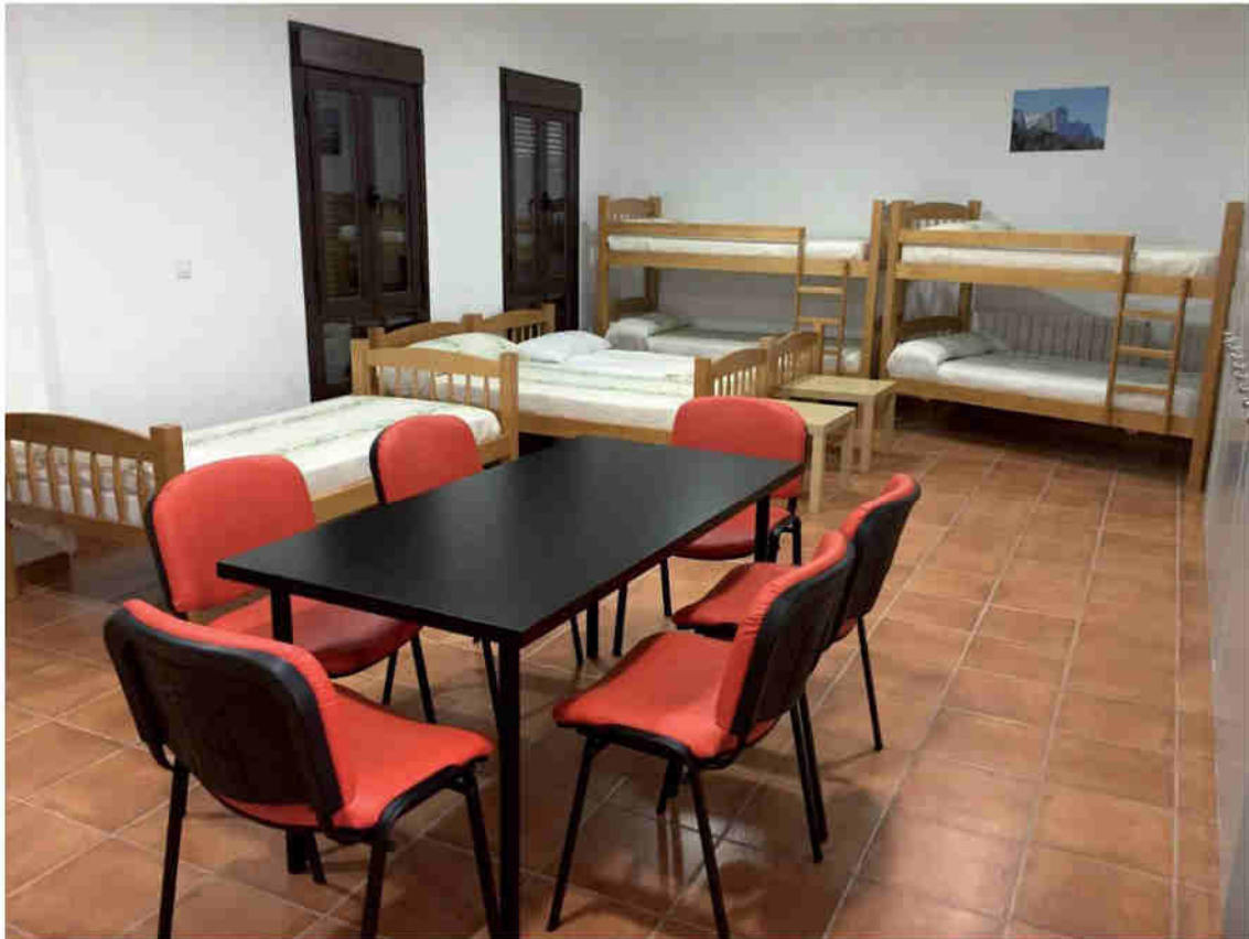
Habitación (las habitaciones en la mayoría de las ocasiones las camas individuales de 90 cm son sustituidas por literas como las que se aprecian en las fotografías)