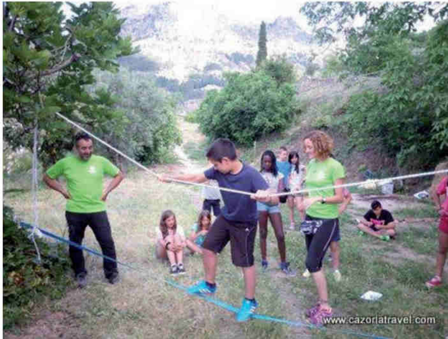
Niños jugando y realizando actividades dentro de las instalaciones