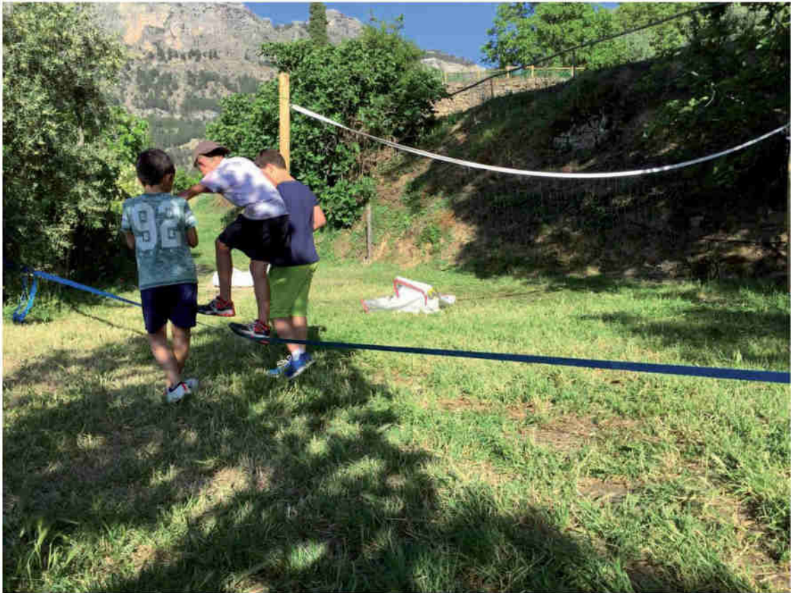
Ninos jugando y realizando actividades dentro de las instalaciones.