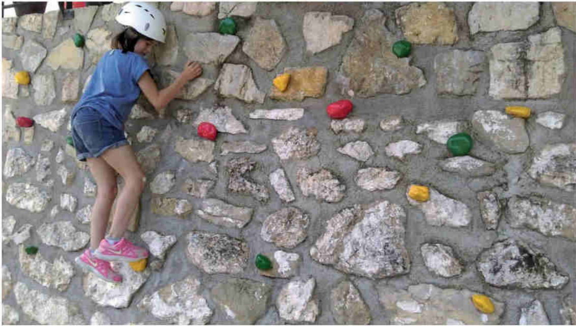
Ninos jugando dentro de las instalaciones