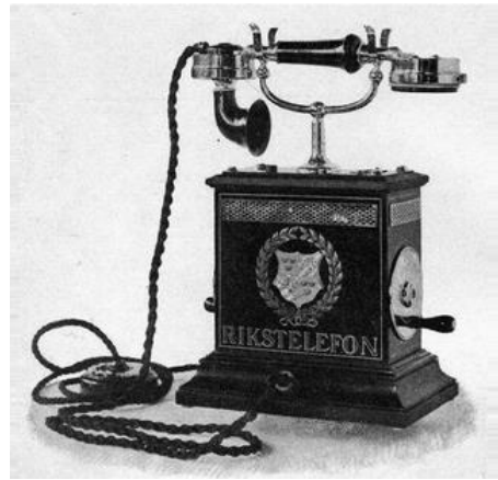
Teléfono. Antonio Meucci